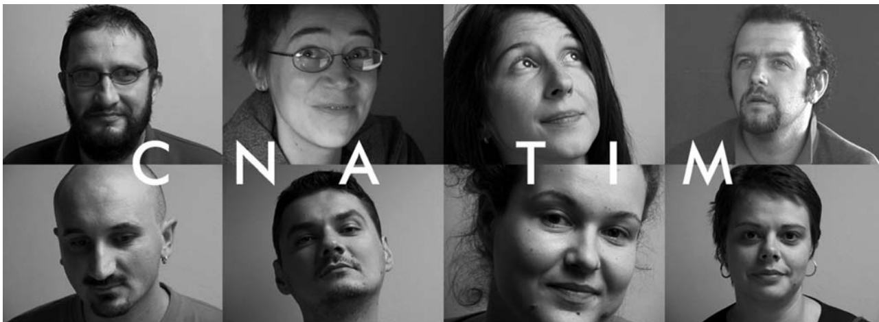
Fotografije: Nedžad HOROZOVIĆ, Nenad VUKOSAVLJEVIĆ i Tamara ŠMIDLING, Prelom: DNN, Dizajn korica: Ivana FRANOVIĆ

Iskustvo da se ljudi raznih nacionalnosti i vjera, na Kosovu, u Makedoniji, Bosni i Hercegovini, Hrvatskoj, Srbiji i Crnoj Gori, mogu razumjeti, podržati i prepoznati zajednički interes izgradnje mira, koje smo često doživljavali tokom prethodnih godina rada, nam daje snage i vjere da istrajemo u našem radu. Uprkos svemu što je bilo i što se ne treba zaboraviti već preispitati, budućnost nam je, ako nikako drugačije, ono najmanje geografski, usko povezana.